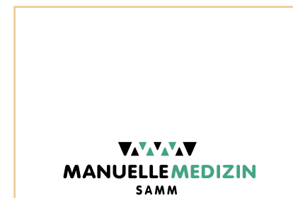
Illustration: Isabelle Pfall - Layout: Media Station