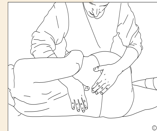
Traitement manuel des vertèbres lombaires

Le médecin qui pratique la Médecine Manuelle va utiliser les mécanismes d'autoguérison de votre corps, pour vous débarrasser des contractures musculaires et des blocages et ainsi restaurer des fonctions articulaires normales et, par là même, atténuer les douleurs. Des investigations diagnostiques sophistiquées peuvent fréquemment être évitées de même que la consommation de médicaments, qui peut être fortement diminuée voire arrêtée.