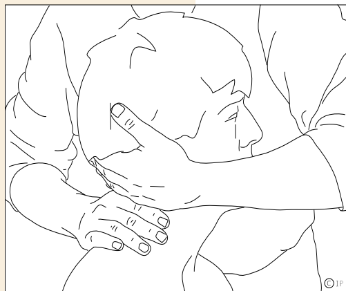
Oscultation manuelle des vertèbres cervicales

Le médecin pratiquant la médecine manuelle palpe avec soin vos muscles, tendons, et articulations, à la recherche de contractures, blocages et autres désordres fonctionnels de votre colonne vertébrale et de vos articulations qui sont susceptibles de vous provoquer des douleurs.